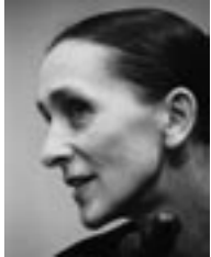
ピナ・バウシュ

10月17日 🇯🇵 18:00- 貫 成人 (専修大学教授) 各公演の半券で入場可。レクチャー参加のみの場合は参加費500円