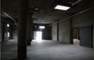
BankART Studio NYK 3F

【日時】 10月17日 🇯🇵 16:00開演 (開演30分前から受付開始) 【会場】BankART Studio NYK 3F 【入場料】前売 ¥2,000、当日 ¥2,500